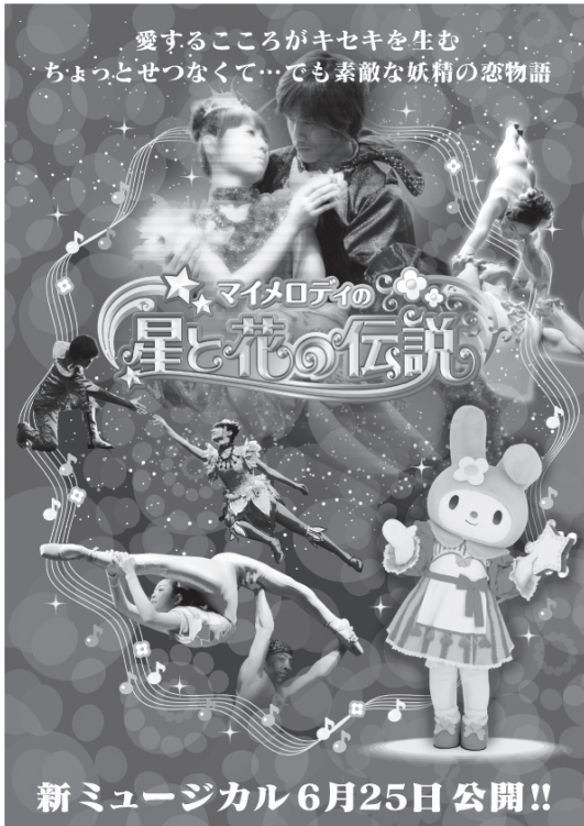
「愛するところがキセキを生む ちょっとせつなくて…でも素敵な妖精の恋物語」。マイメロディが感動のラブロマンスの世界にいざないます。