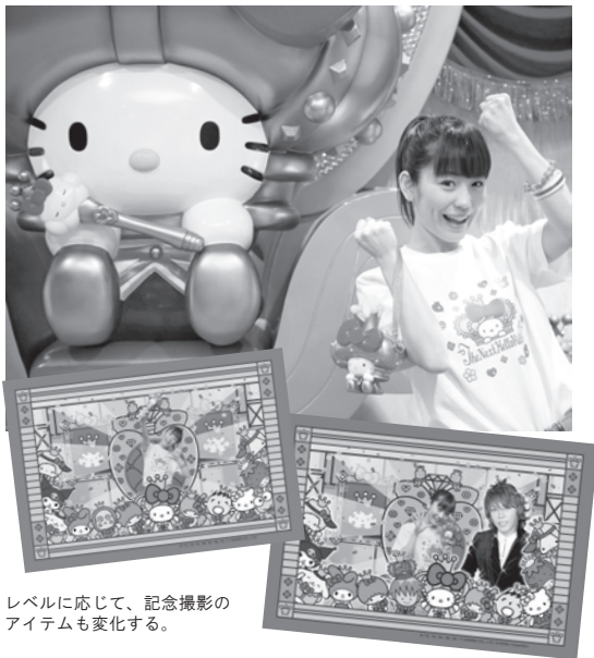
レベルに応じて、記念撮影のアイテムも変化する。