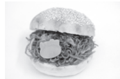
焼きそばバーガー