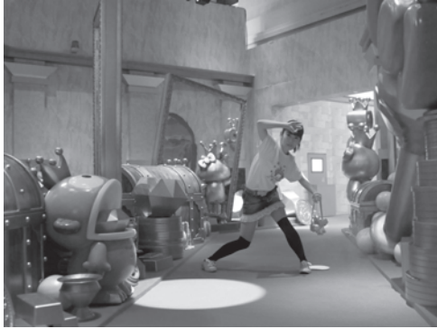
「クイーンズ・サーチ」 スポットライトをくぐり抜け、ゴールを目指す。