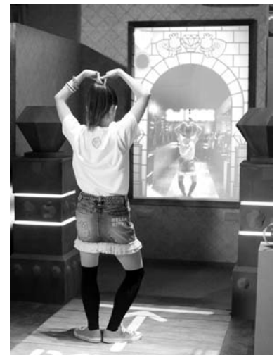
「ものまねブリッジ」でポーズを決めよう!

集めたコインの枚数に応じて「キングダム」、「ナイト」、「バトラー」、「パブリシティ」、「プリズナー」の5つのレベルが決定。レベルにあわせてフォトフレームデザインも変化します。